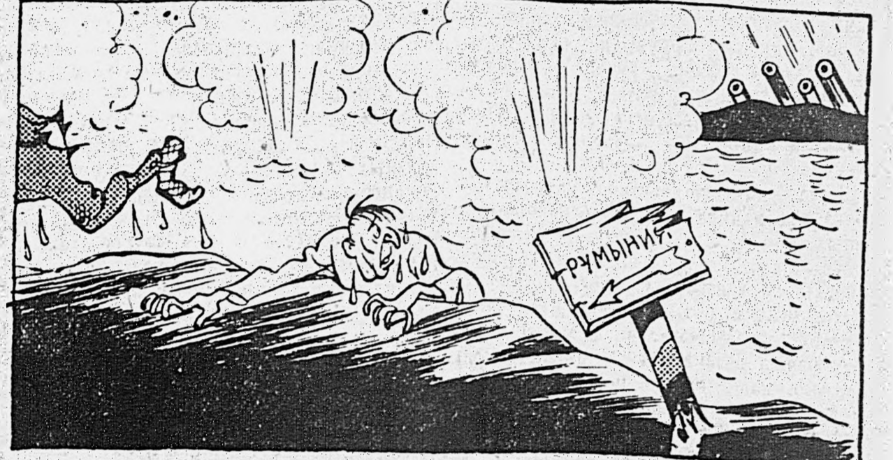
Март 1944 года — Прут!