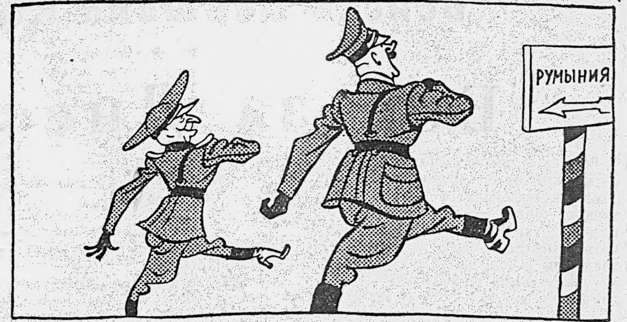
Июнь 1941 года — «вперед»...