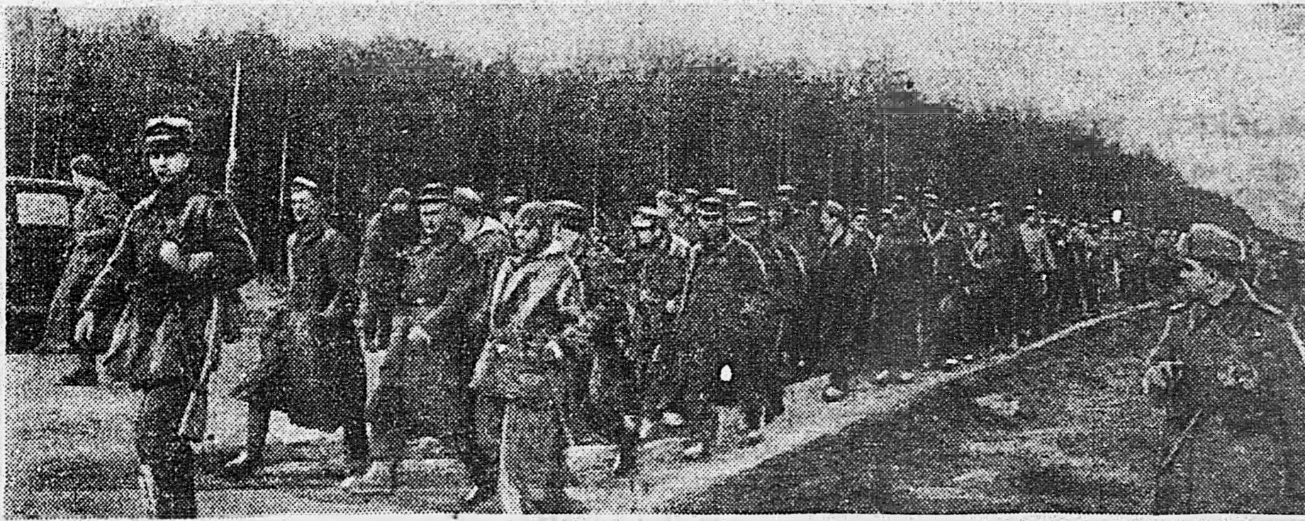
В ПРОСКУРОВЕ. 1. Жители города встречают проходящие части Красной Армии. 2. Немецкие солдаты и офицеры, взятые в плен в боях за Проскуров. Доставлены на самолете летчиком лейтенантом П. Быстрым.