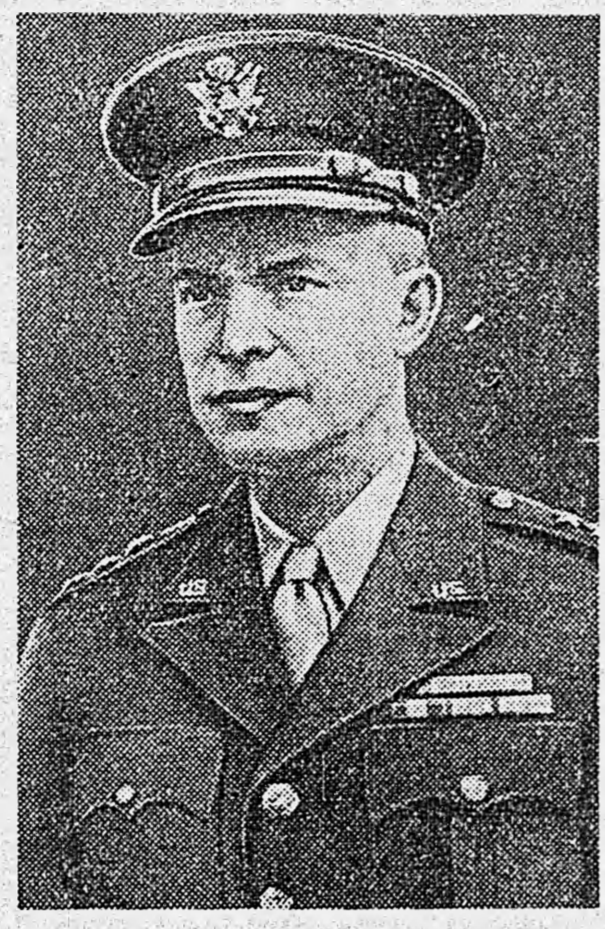
Генерал Дуайт Д. Эйзенхауэр

После вступления США в вторую мировую войну Эйзенхауэр проявил себя как один из наиболее выдающихся американских