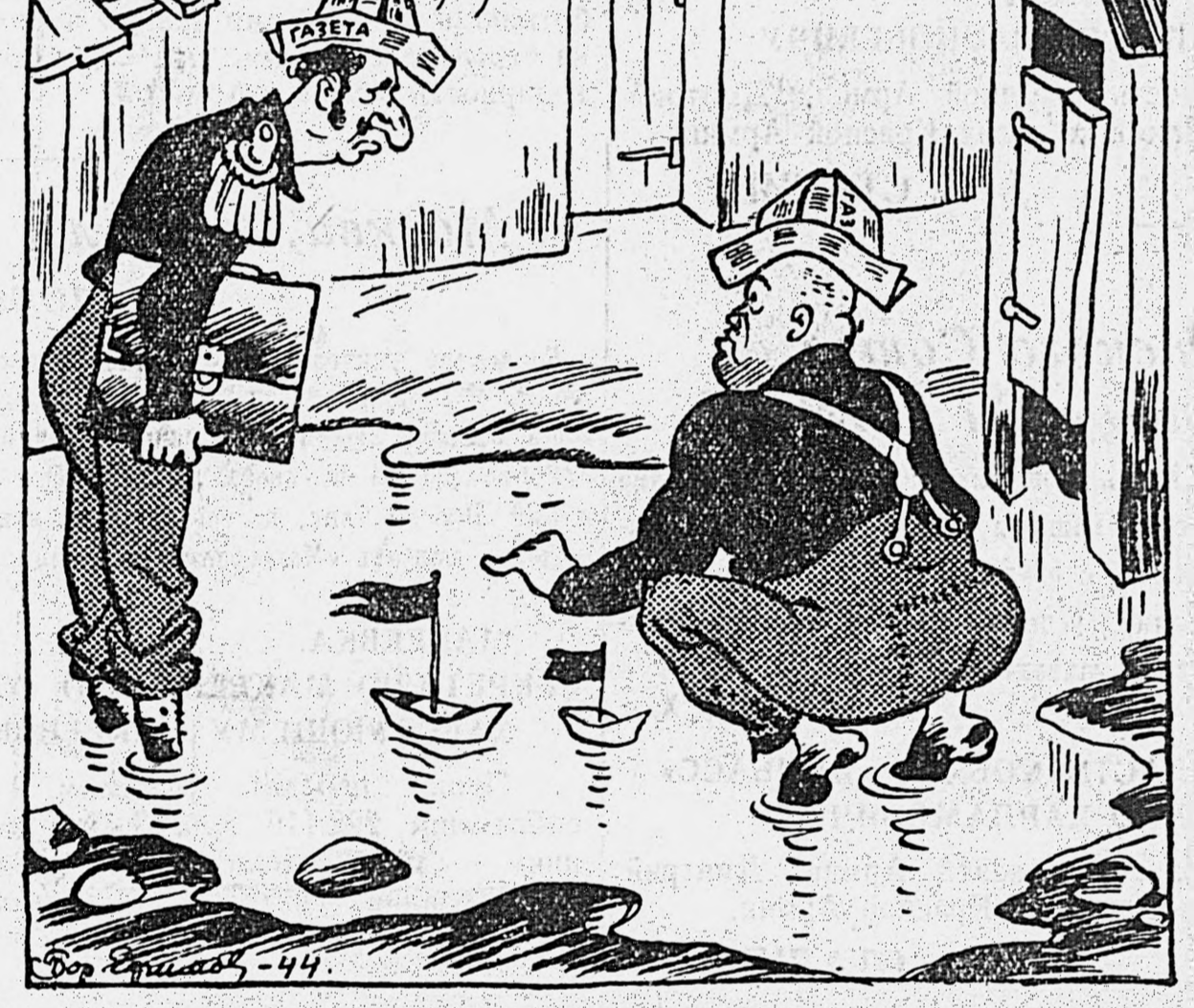
Энергичная деятельность военно-морского ведомства.