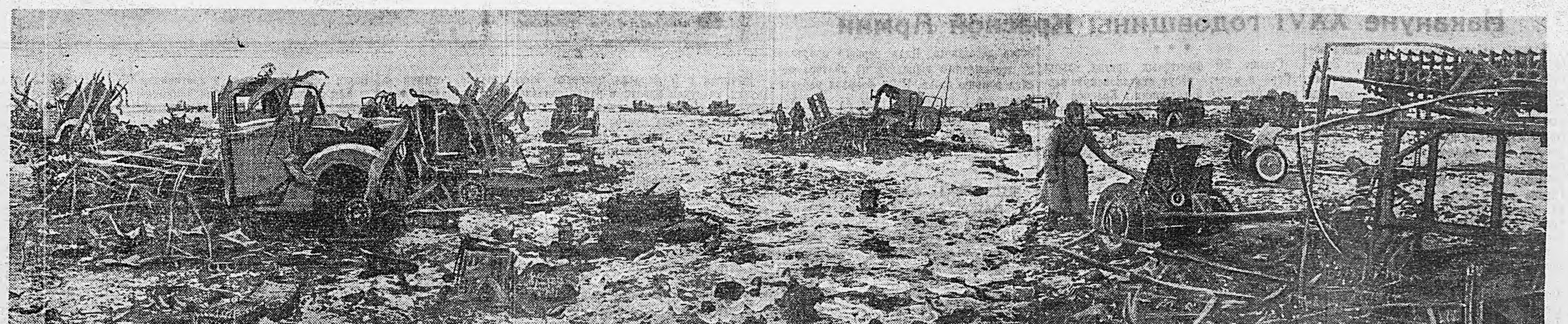
2-й УКРАИНСКИЙ ФРОНТ. Вот все, что осталось от крупной немецкой мины автоколонны гитлеровцев, превратили ее в груды искореженного металла. автоколонны, попавшей на этой равнине под огневые удары нашей авиации и артиллерии. Советские самолеты с воздуха, а батареи с земли полностью разгромили автоколонну гитлеровцев, превратили ее в груды искореженного металла.

лины. Салют войскам 2-го Украинского фронта передавался по радио. Его слушала вся страна, с законной гордостью за свои боевые дела его слушал фронт. (ТАСС).