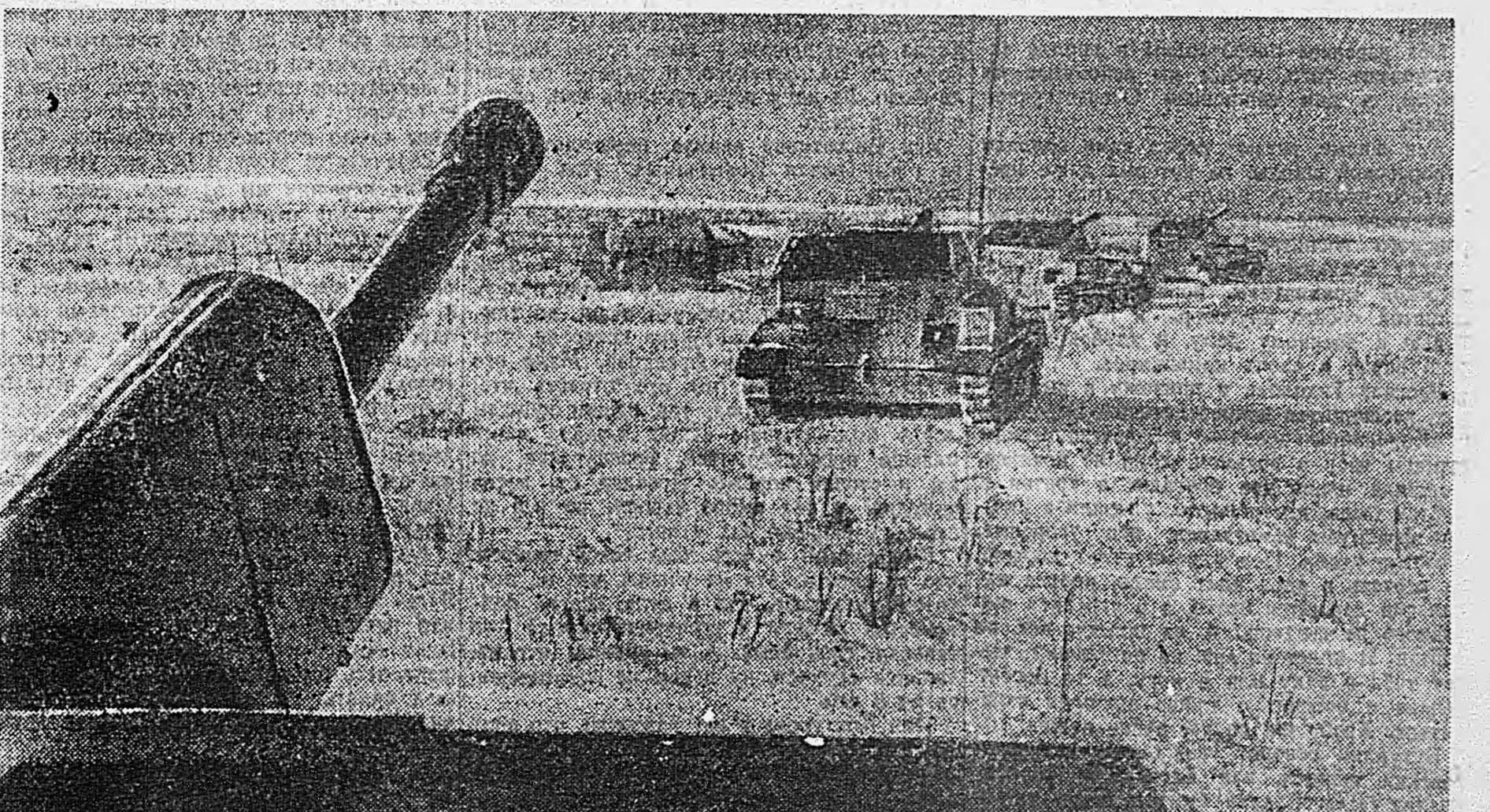
ДЕЙСТВУЮЩАЯ АРМИЯ. Самоходные орудия Н части развертываются для атаки.