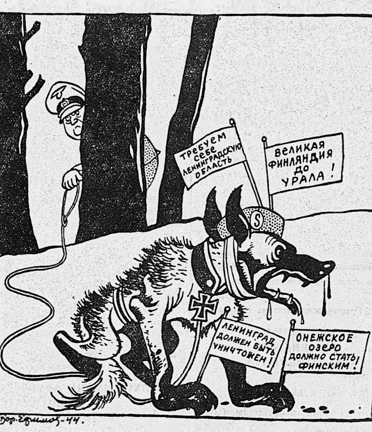
Рис. Бор. Ефимова.