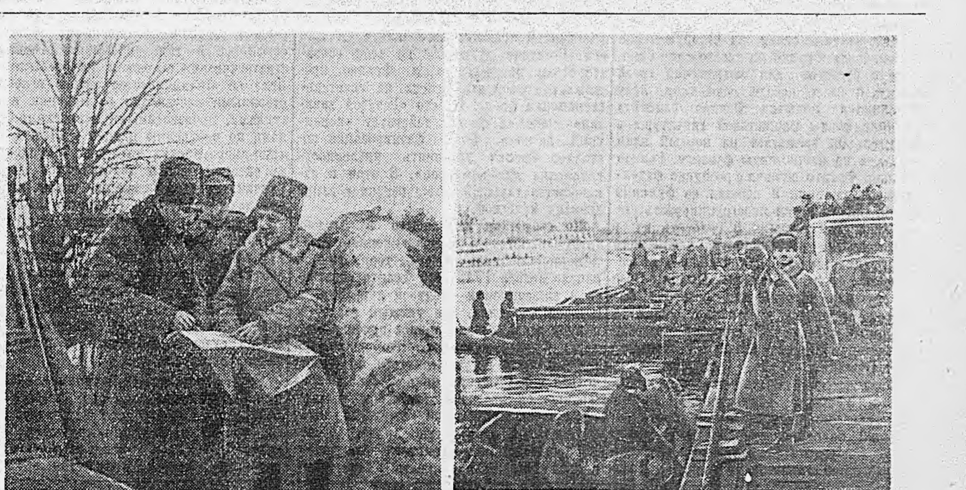
ВОЛХОВСКИЙ ФРОНТ. 1. Генерал-майор Миккульский (справа) дает задание офицерам. 2. На переправе.

КАТИНСКИЙ ЛЕС, 30 января. (Спецкорр. ТАСС.)