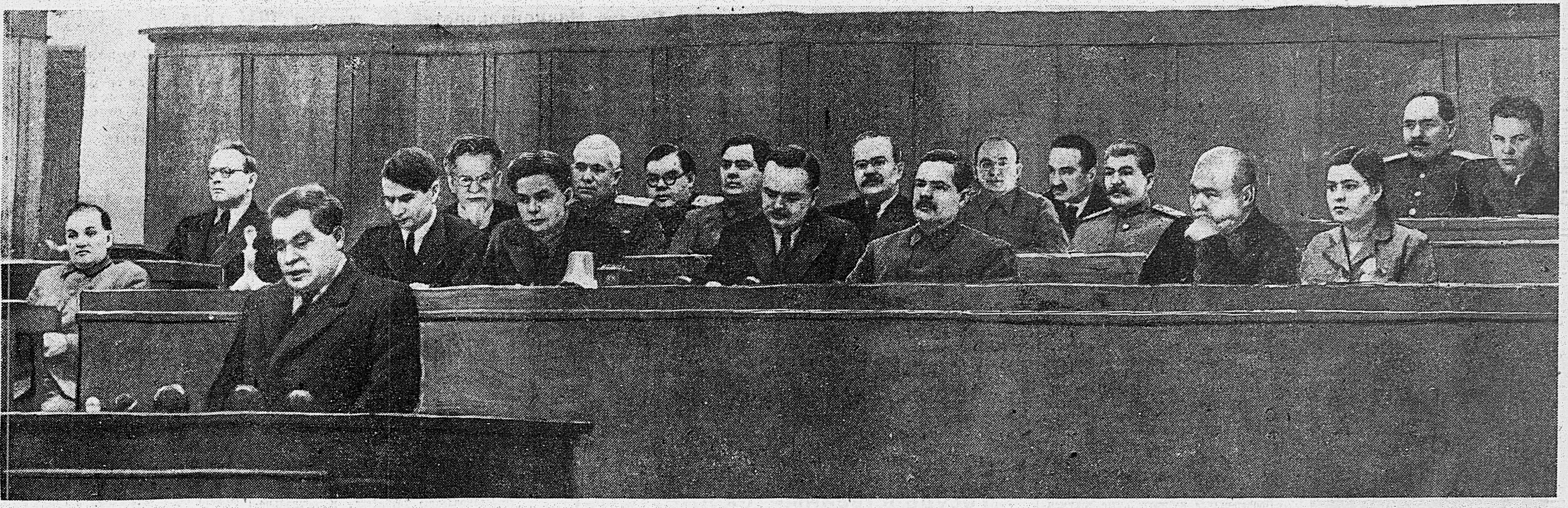
X сессия Верховного Совета СССР. На совместном заседании Совета Союза и Совета Национальностей 28 января. Тов. А. Г. Зверев делает доклад о государственном бюджете.

Вчера в Кремле открылась X сессия Верховного Совета СССР 1-го созыва. На совместном заседании Совета Союза и Совета Национальностей с докладом о государственном бюджете СССР на 1944 год и исполнении государственного бюджета за 1940, 1941 и 1942 годы выступил Народный Комиссар финансов СССР тов. А. Г. Зверев.