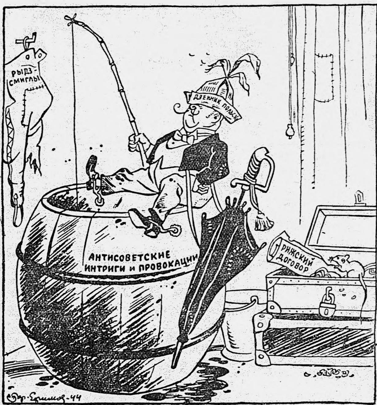
Боевые труды «воинствующего панства».