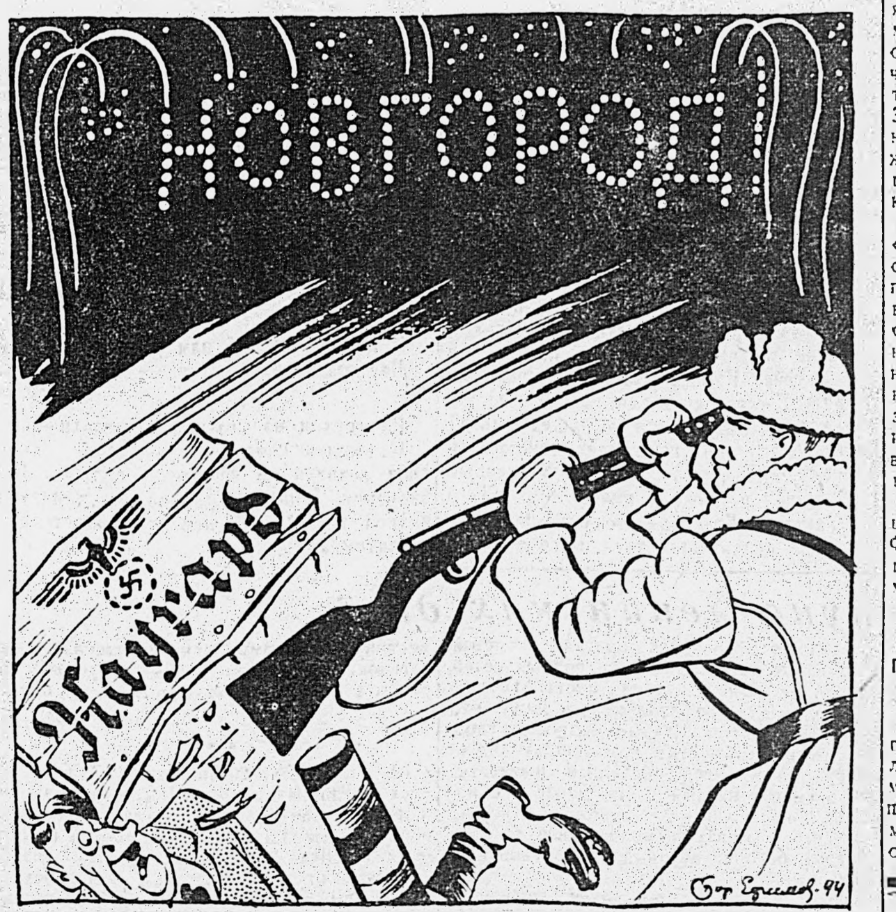
Исправленному — верить!