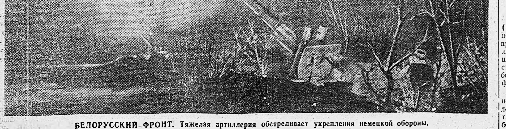
БЕЛОРУССКИЙ ФРОНТ. Тяжелая артиллерия обстреливает укрепления немецкой обороны.

Здесь бой также был на редкость напряженным. Наши бойцы, особенно артиллеристы, мужественно встречали врага и стойко отбивали все его удары. Когда на одном участке немцы начали было вклиниться в боевые порядки передовых подразделений, командир части бросил впереводку противнику свой артиллерийский резерв. Сильные артиллеристы быстро выдвинулись вперед, развернули свои пушки и прямо с хода встретили противника губительным огнем. В первые же минуты удалось подбить несколько неприятельских танков, а остальные вынуждены были отступить.