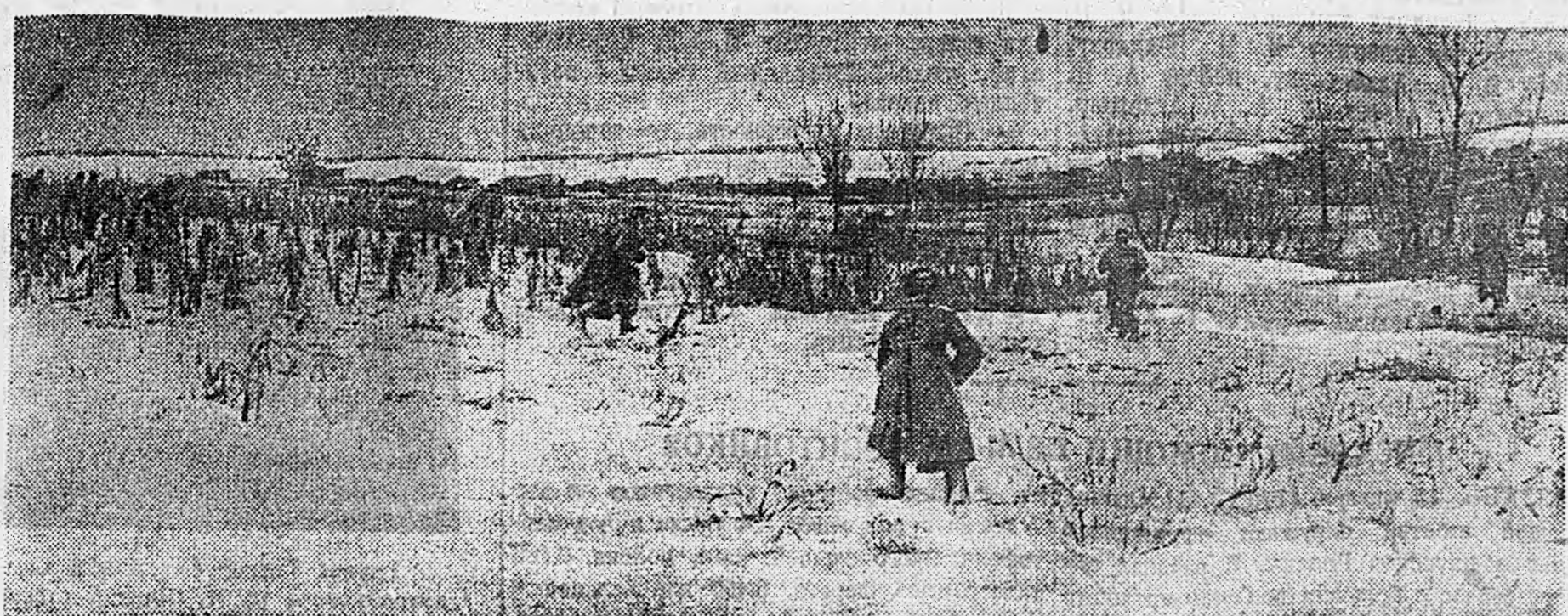
2-Я УКРАИНСКИЙ ФРОНТ. Автоматчики атакуют населенный пункт.

Для успеха атаки зимой надо обеспечить пехоте возможность быстро передвигаться на поле боя. Каждое наступление по глубокому снегу против прочной обороны надо обеспечивать дополнительными колесными путями, отрывкой траншей в снегу. Следовательно, забота о повышении подвижности войск является в то же время заботой и о повышении их маневренности.