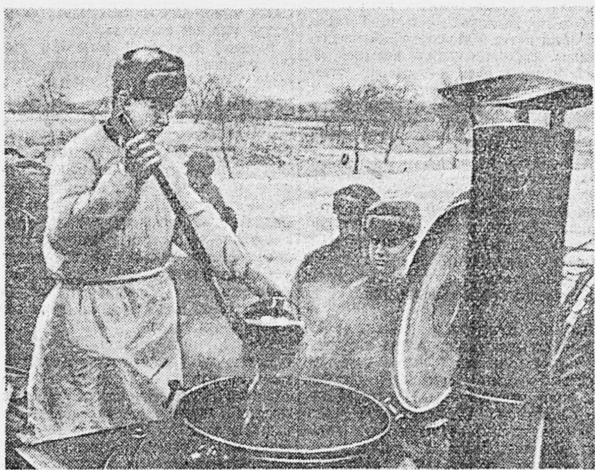
ДЕЙСТВУЮЩАЯ АРМИЯ. На передовые позиции приехала полевая кухня.